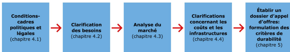
Figure 2: Étapes à considérer avant l'achat

Pour optimiser le nettoyage d'un point de vue écologique, il est recommandé de réfléchir à quelques points fondamentaux avant l'achat. L'accent est mis sur l'étendue de la gamme de produits, le choix de produits écologiques, le bon dosage et l'élimination correcte.